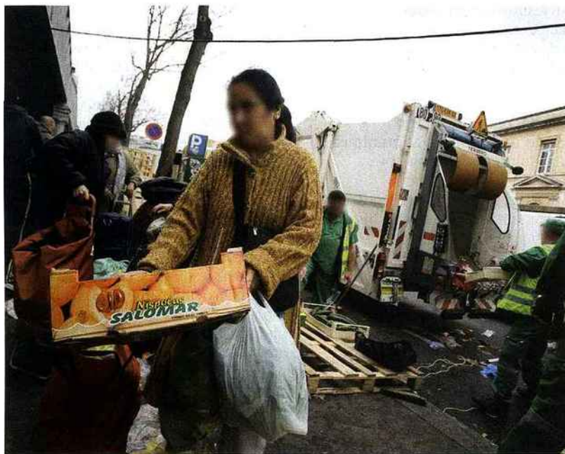
Fin de marché à Barbès (XVIII e ). De plus en plus nombreux, ils glanent les invendus.

« Malgré la flambée des prix, la France a touché 50 982 500 millions d'euros, cette année, contre 49 815 000 millions, l'an dernier, soit un budget quasi constant, rapporte Pierre de Poret, président de la Fédération française des banques alimentaires. Mécaniquement, les tonnages que nous récupérerons seront inférieurs, sans doute, de 10 % environ. »